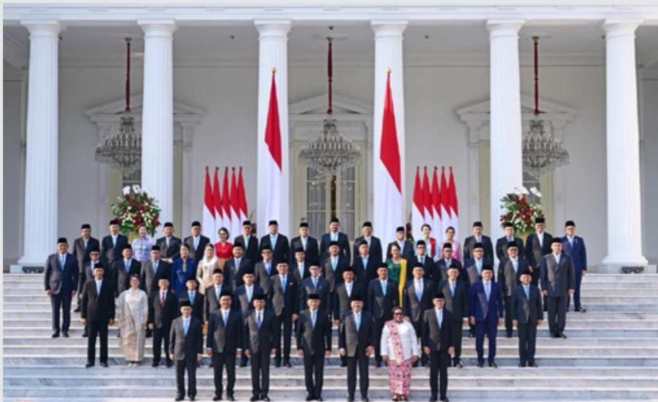
Pelantikan para wakil menteri Kabinet Merah Putih masa jabatan periode tahun 2024-2029 di Istana Negara, Jakarta, Senin (21/10/2024).

HTTPS://WWW.SETNEG.GO.ID/BACA/INDEX/PRESIDEN-PRABOWO-RES-M-LANTIK-PARA-WAKIL-MENTERI-KABINET-MERAH-PUTIH