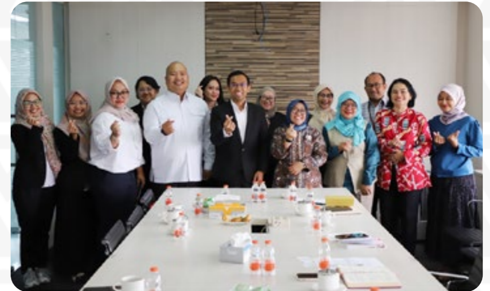
MK melakukan kunjungan kerja ke Pusat Pembinaan Penerjemah (Pusbinter) Sekretariat Negara pada Rabu (17/9).