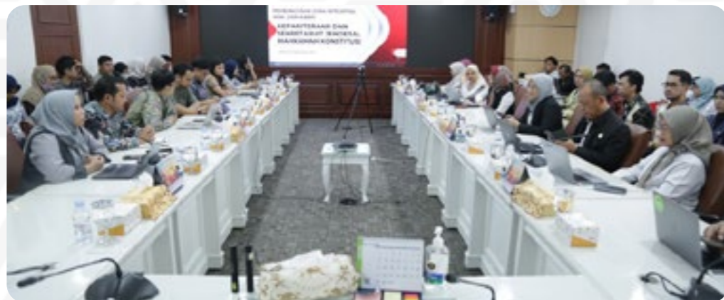
Benchmarking Pembangunan Zona Integritas Kementerian UMKM ke MK, Kamis (11/9).