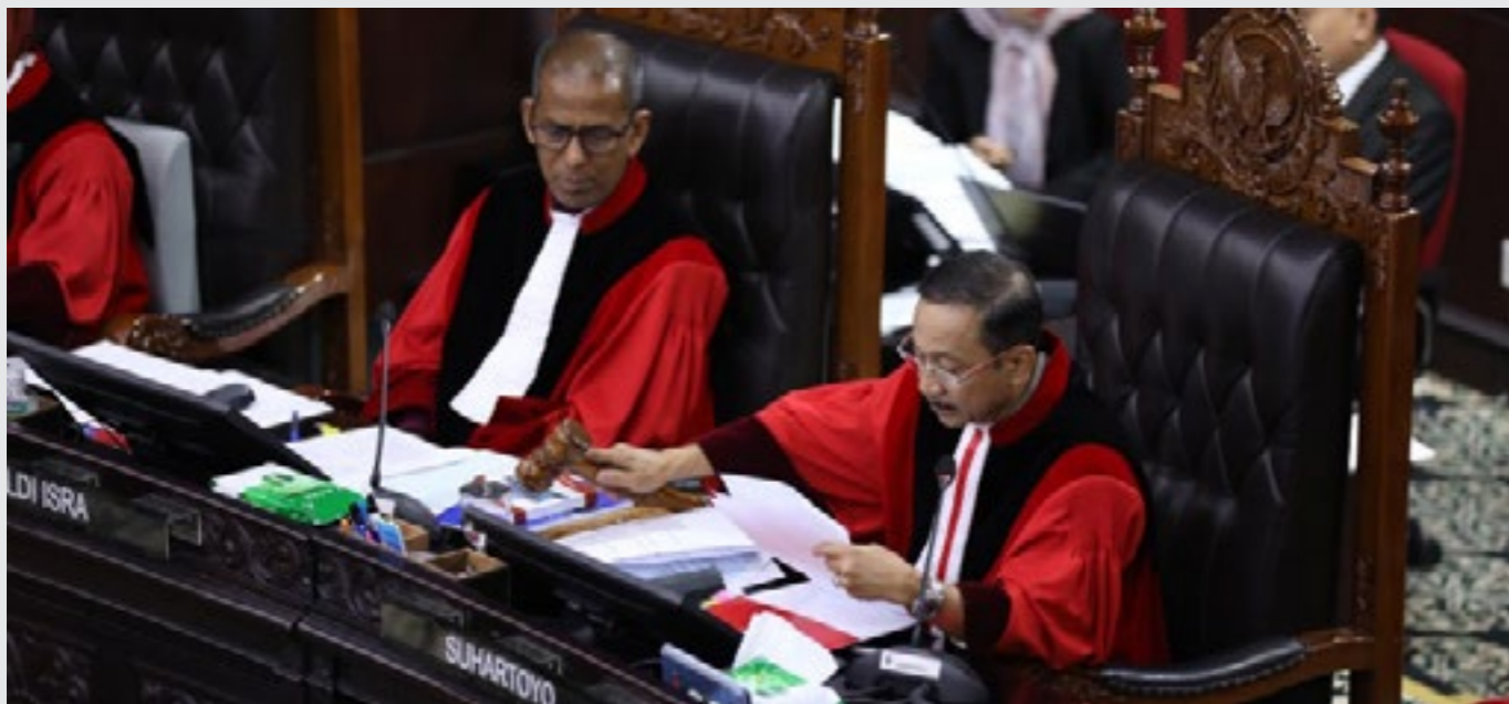
Ketua MK Suhartoyo dan Wakil Ketua Saldi Isra, pada persidangan pengucapan putusan penguji Undang-Undang tentang rangkap jabatan Wakil Menteri, Kamis (28/08) di Ruang Sidang MK.

terhadap Undang-Undang Dasar Negara Republik Indonesia Tahun 1945 (UUD 1945). Lebih spesifik lagi, objek yang diujikan yaitu kata “Menteri” dalam Pasal 23 UU Kementerian Negara. Menurut para Pemohon, kata “Menteri” dalam Pasal 23 UU Kementerian Negara bertentangan secara bersyarat ( Conditionally Unconstitutional ) dengan Pasal 1 ayat (3), Pasal 17 ayat (3), dan Pasal 28D ayat (1) UUD 1945, sepanjang tidak dimaknai “termasuk Wakil Menteri”.