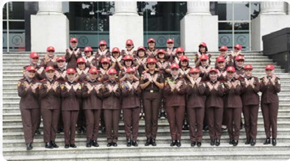
MK menerima Kunjungan dari Badan Pendidikan dan Pelatihan Kejaksaan Agung, pada Selasa (9/9).